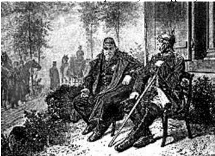
Зустріч Бісмарка і Наполеона III після капітуляції під Седаном

імператор Франції Наполеон III. 2 вересня після нетривалих переговорів Наполеон III підписав акт про капітуляцію французької армії.