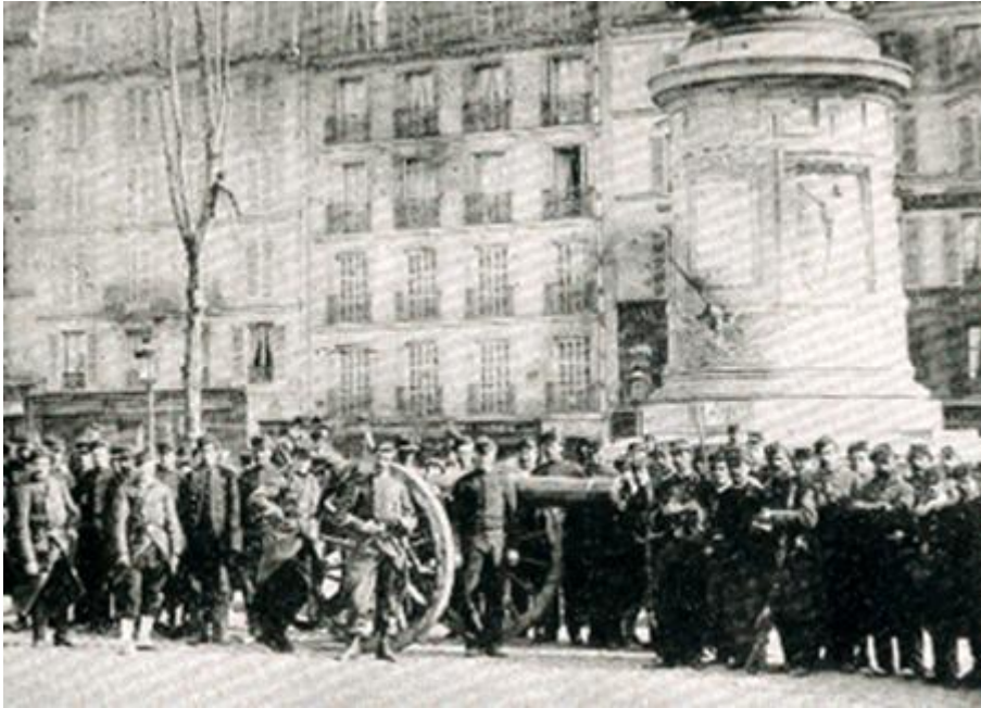
Спроба захопити артилерію Народної гвардії

Через це Тьер віддав наказ про евакуацію урядових установ до Версаля. Разом з урядом із столиці виїхали представники заможних верств суспільства. Єдиною авторитетною силою в Парижі залишився ЦК Національної гвардії, який перебрав владу в столиці та призначив на 26 березня вибори до Паризької комуни (так за традицією у Франції називався орган самоврядування Парижа). Спроби примирити уряд і ЦК Національної гвардії успіху не мали. Уряд дав зрозуміти, що вважає паризьких опозиціонерів злочинцями, з якими мають розмовляти гармати.