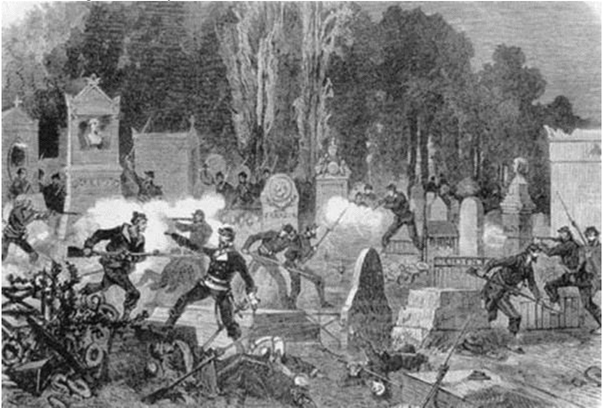
Бій комунарів з Версальцями

У травні настав злам. Уряд Тьєра, отримавши допомогу від німецького командування зброєю та солдатами (полонених лід час війни французьких солдатів було достроково звільнено), перейшов у наступ, і 21 травня 1871 р. війська версальців вдерлися до Парижа. Бої тривали до 28 травня. Останній форт, що його захищали комунари, капітулював 30 травня. 72-денна влада Паризької комуни скінчилася.