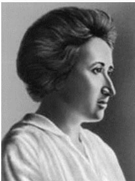
Лідери німецької соціал-демократії кінця XIX – початку XX ст.: Е. Бернштейн, К.К;аутський, Р.Люксембург