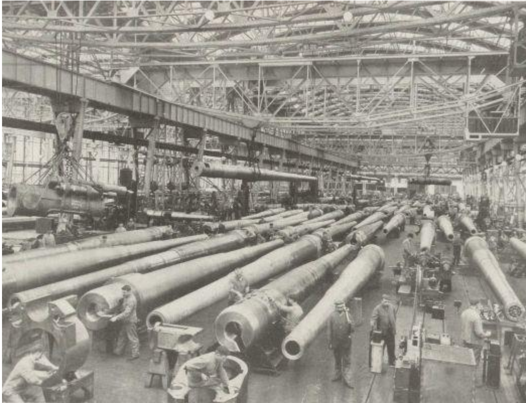
Виробництво гармат на заводі Круппа

Наприкінці XIX ст. в Німеччині, як і в інших індустріальних державах, з'явилися монополії. У 1914 р. в країні їх налічувалося 600. Найпоширенішою формою монополістичних об'єднань були картелі й синдикати. 85% фінансових капіталів контролювали 8 банків. Найвідомішими були монополії: Круппа, Рейнсько - Вестфальський чавуноливарний картель, Німецький союз прокатних заводів, Рейнсько - Вестфальський кам'яновугільний синдикат та ін.