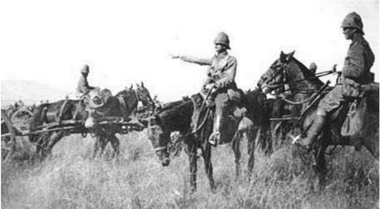
Англійські війська на Півдні Африки

На початку XX ст. колоніальна експансія Англії тривала. Прагнучи створити неперервну лінію британських володінь від Каїра до Кейптауна і захопити природні багатства Південної Африки, англійці 1899 р. розпочали війну проти двох невеликих південноафриканських республік - Трансваалю та Оранжевої (Помаранчевої). Вони були багаті на золото й алмази, населяли їх бури – вихідці з Голландії, які колонізували ці території, а місцеве населення перетворили на рабів.