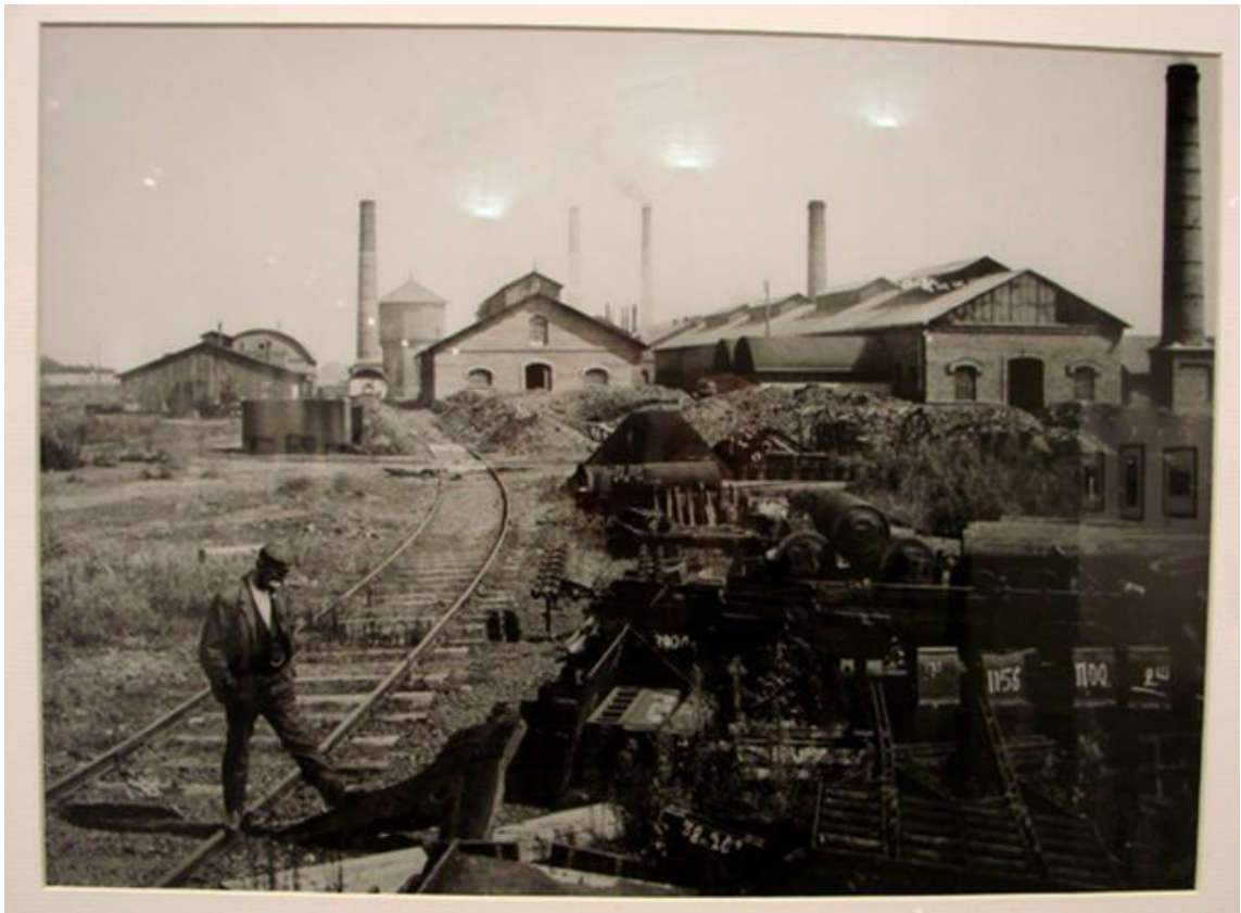
Один з металургійних заводів

Великого розмаху набуло залізничне будівництво. Довжина залізничної мережі зростає з 1488 км у 1861 р. до 52 тис. км наприкінці XIX ст.