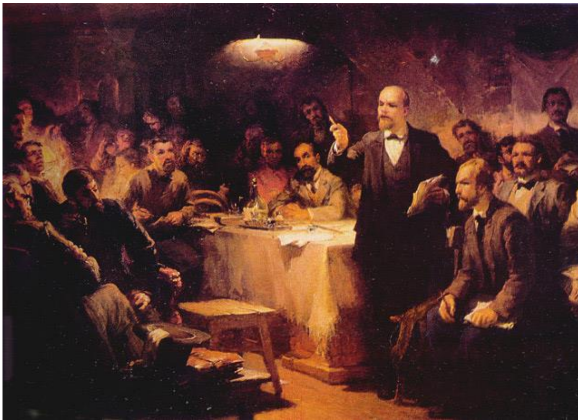
Ленін виступає на II з'їзді РСДРП

На виборах центральних органів партії більшість голосів набрали "тверді", які згодом почали називатися більшовиками, а м'які" - меншовиками. З часом розбіжності між двома фракціями поглибилися настільки, що фактично утворилися дві партії: РСДРП(б) і РСДРП(м). В. Ленін і Г. Плеханов розійшлися в багатьох важливих питаннях стратегії й тактики робітничого руху.