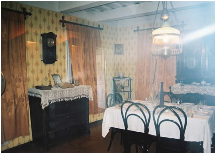
Кімната, в якій відбувався перший з'їзд РСДРП

На початку ХХ ст. відродити РСДРП запропонували Ленін, Мартов та Ін. Ленін виїхав за кордон. За підтримки діячів групи "Визволення праці" він організував випуск загальноросійської соціал-демократичної газети "Искра". Вона, за його задумом, повинна була підготувати ідейно-політичні та організаційні передумови відтворення соціал-демократичної партії. Редагував газету Ленін разом із Плехановим.