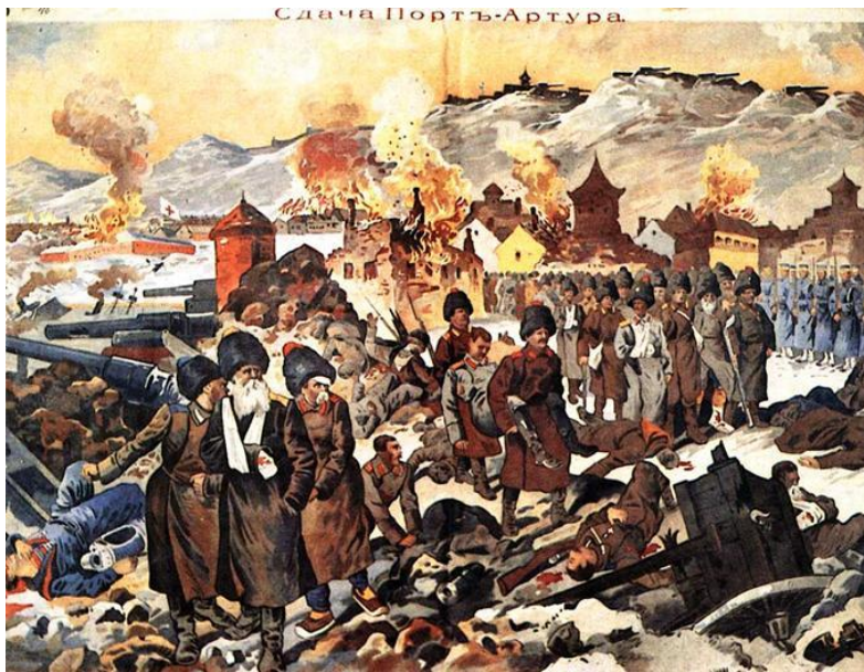
Російські війська залишають Порт-Артур

5 серпня 1905 р. у Портсмуті (США) було підписано мир, згідно з яким Японія встановлювала протекторат над Кореєю. Порт-Артур, залізниця в Південній Маньчжурії, а також південна частина о. Сахалін відходили до Японії.