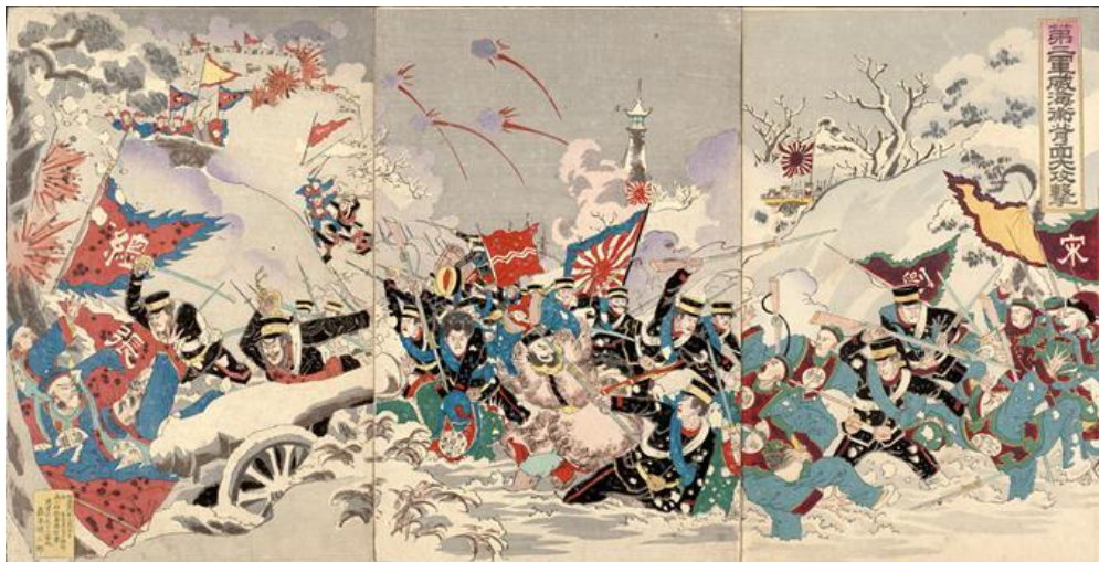
Сцена японо-китайської війни

Першим об'єктом експансії Японії на материк стала Корея, яка знаходилась у васальній залежності від Китаю. Накинувши Кореї в 1876 р. нерівноправний договір, Японія розширила експансію під приводом сприяння національно-визвольному рухові. Коли на початку 90-х рр. у Кореї вибухнуло повстання і китайські війська виступили на його придушення, Японія спрямувала свої армійські частини на південь півострова. Конфлікт на Корейському півострові вилився в японсько-китайську війну 1894- 1895 рр., яка закінчилася поразкою Китаю і підписанням мирного договору. Китай визнав незалежність Кореї, передав Японії Тайвань і Пескадорські острови, відкрив для Японії торговельні порти, надав право будівництва підприємств і зобов'язався виплатити величезну контрибуцію.