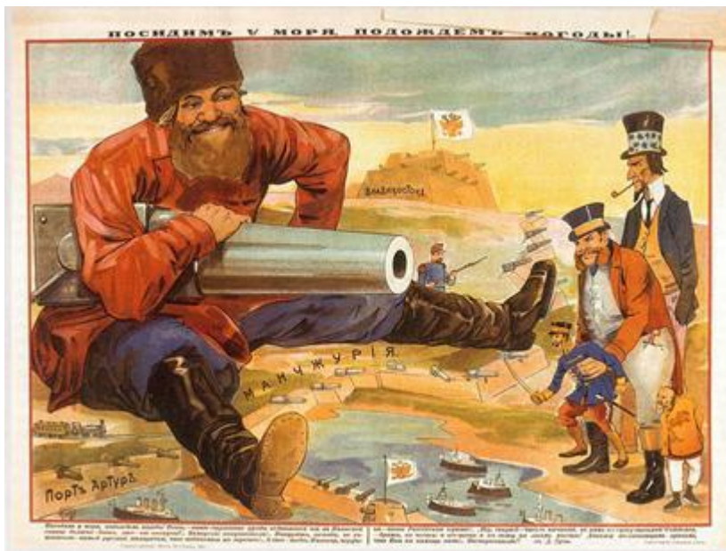
Російська листівка напередодні війни з шапкозакидальськими настроями

На початку XX ст. Японія зважилася на гострий конфлікт із царською Росією. Широка антиросійська кампанія, яка стала частиною загальної пропаганди націоналізму й шовінізму в Японії та ідеологічної підготовки до реалізації планів створення "Великої Азії", особливо посилилася після підписання англо - японської угоди 1902 р. та отримання англійських кредитів.