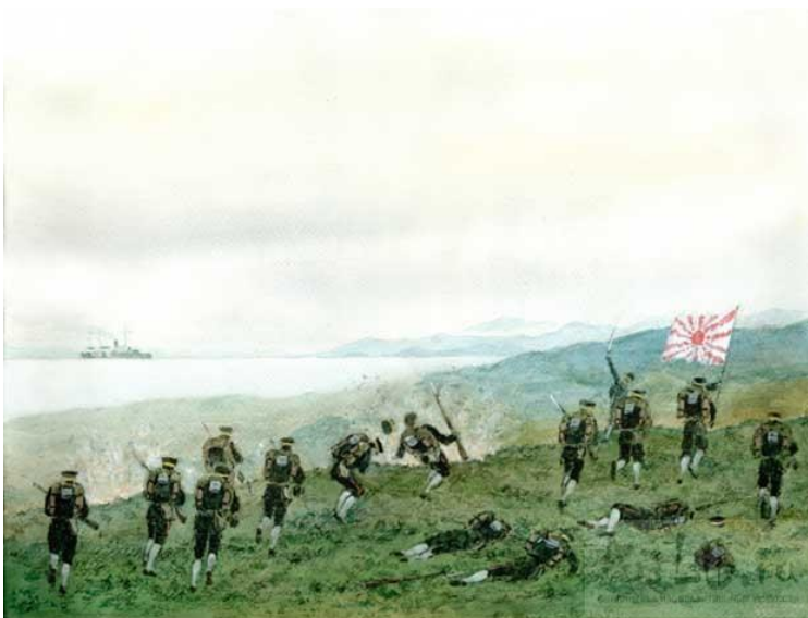
Атака японської піхоти на Порт-Артур

Загибель 2-ї Тихоокеанської ескадри 28 травня 1905 р. в Цусімській протоці трагічно завершила війну.