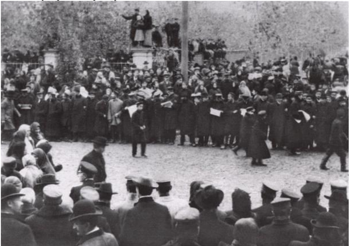
Мітинг під час Всеросійського жовтневого страйку в м.Харков. 1905 р.

Безпосереднім поштовхом до буржуазно-демократичної революції став розстріл великої мирної демонстрації робітників у Петербурзі у неділю 9 січня 1905 р., що згодом названа «Кривавою неділею». Відповіддю на нього стали численні стихійні виступи. Одним з них став страйк 600 робітників Південноросійського машинобудівного заводу та заводу Гретера і Криванека у Києві 12 січня 1905 р. Протягом січня страйкували робітники Харкова, Катеринослава, Одеси, Горлівки, Юзівки, Маріуполя, Житомира та інших міст. Протягом лютого-березня страйковий рух зростав, адже за неповними даними в українських губерніях страйкували майже 170 тис. осіб.