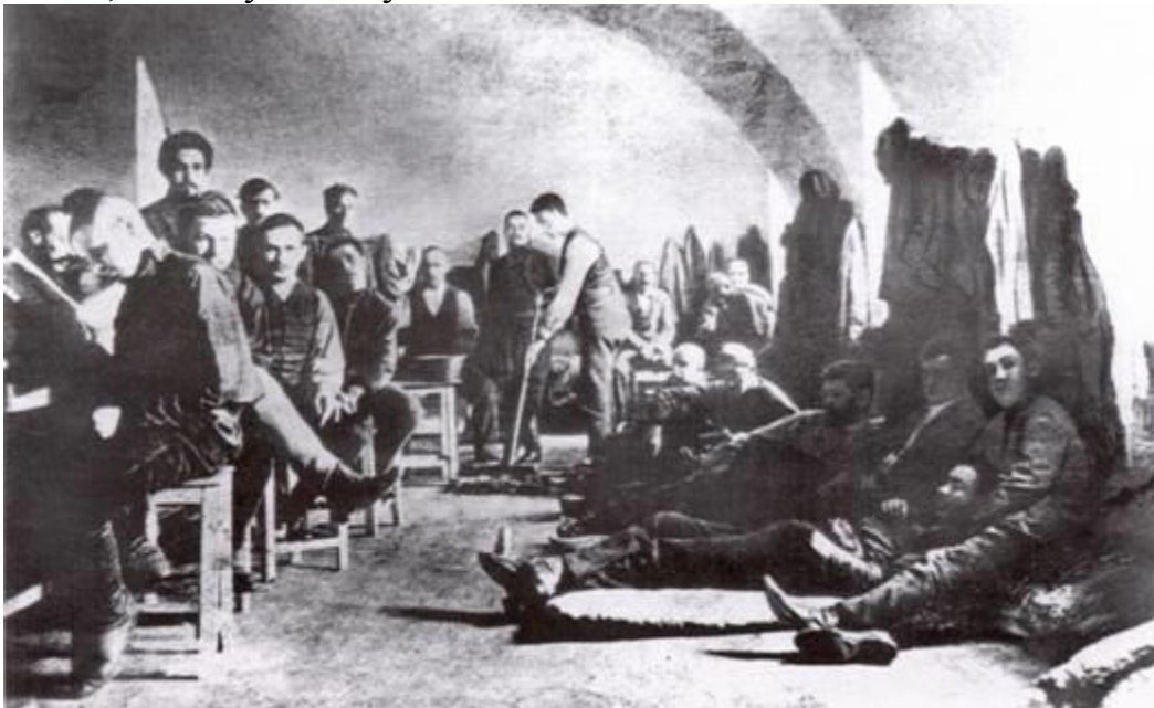
Група учасників повстання саперів у дворі Лук'янівської в'язниці в м.Київ. 1905 р.

У листопаді 1905 р. у Севастополі сталося нове повстання моряків Чорноморського флоту на крейсері «Очаків», яке підтримали ще 12 кораблів. Очолив його лейтенант П.Шмідт, який у телеграмі Миколі II писав: «Царю, Чорноморський флот вийшов з підпорядкування твоїм безвідповідальним міністрам, відрізав Кримський півострів, оголошує федеративну республіку Кримського півострова, вимагає повної амністії політичним в'язням і якнайшвидшого скликання Установчих зборів». Після 13-годинного бою з відданими царизму військами повстанці зазнали поразки. П.Шмідт та його поплічник були арештовані і за вироком військового трибуналу страчені. 18 листопада того ж року у Києві повстали 800 солдатів саперної бригади на чолі з підпоручиком Б.Жаданівським. Солдати, об'єднавшись з робітниками Південноросійського заводу, вирушили до казарм Азовського полку. Після короткого бою повстанців з вірними владі військами повстання було придушене. 23 листопада відбувся виступ солдатів Харківського гарнізону та робітників, в якому взяли участь близько 15 тис. осіб.