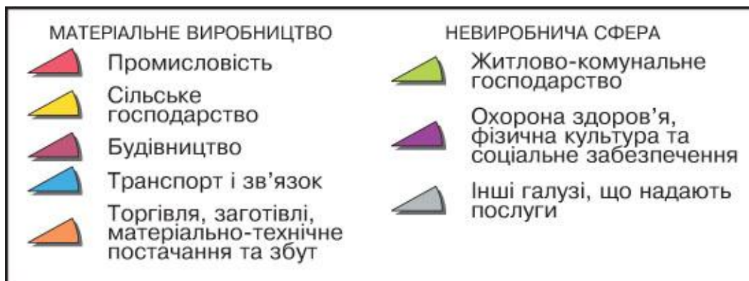
Мал. Галузева структура господарства

У сфері послуг створюються духовні блага та послуги невиробничого й виробничого характеру. Одні галузі цієї сфери обслуговують безпосередньо населення (культура, освіта, медичне і рекреаційне обслуговування, побутове обслуговування), інші — населення і виробництво (транспорт і зв'язок, фінанси і кредит, торгівля, страхування), треті забезпечують функціонування суспільства взагалі (наука, управління).