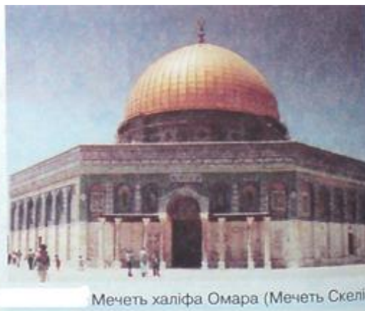
Мечеть халіфа Омара (Мечеть Скепі)

Азія — батьківщина світових релігій. Найпоширенішими є мусульманство, буддизм, індуїзм. Складність стосунків, що пов'язана з релігійними віруваннями населення окремих країн регіону, призводить до міжетнічних та релігійних конфліктів (Індія, Пакистан, Афганістан та ін.), які часто відбуваються під гаслами сепаратизму — прагнення до відокремлення. Важливу роль у розвитку господарства окремих країн