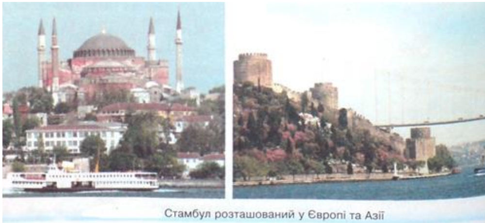
Стамбул розташований у Європі та Азії

Населення. Регіон населяють близько 3,5 млрд осіб, це 60% населення Землі. Багато країн перебувають на стадії демографічного вибуху (Китай, Індія), що певною мірою впливає на економічні, екологічні та соціальні проблеми народів, які там проживають. І Через це уряди окремих країн змушені проводити демографічну політику, спрямовану на зниження народжуваності. В Азії етнічний склад населення є досить різноманітним: налічується близько 1 тис. народів, які належать до 9 мовних груп і розмовляють майже 600 мовами. Більшість країн можна назвати багатонаціональними (Індія, Філіппіни, Індонезія, Китай та ін.). До найбільших етнічних груп належать китайці, хіндустанці, бенгальці, японці, біхарці. Густота населення в різних районах істотно різниться між собою. Якщо в Бангладеші вона досягає 900 осіб на 1 км 2 , то в окремих місцях Центральної і Південно-Західної Азії становить 2 особи на 1 км 2 . Рівень урбанізації нижчий, ніж в інших регіонах світу, але темпи її є досить значними. З 20 найбільших міст світу 12 розташовані в Азії - Токіо (27 млн осіб), Колката (15 млн), Шанхай (15 млн), Мумбаї (14 млн), Пекін (13 млн), Тегеран (понад 12 млн), Сеул (12 млн), Джакарта (11 млн), Осака (11 млн), Тяньцзінь (11 млн), Нью-Делі (10 млн), Стамбул (10 млн осіб).